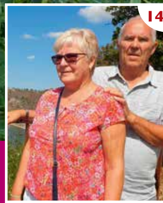
Møte mellom mennesker