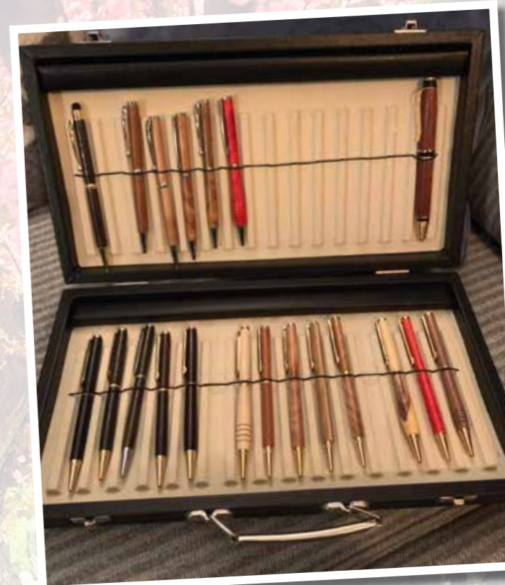
Et utvalg av Runes pinner.