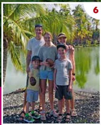
Intervju med familien Sørheim